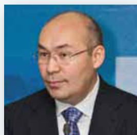
Кайрат Келимбетов Председатель правления фонда АО "Самрук-Казына"