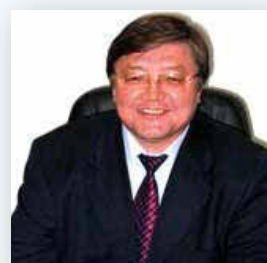
Болат Ужкенов Председатель КГИН МИНТ РК