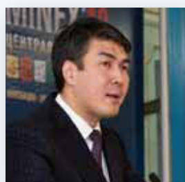
Асет Исекешев * Вице-премьер министр, Министр Индустрии и Новых Технологий Республики Казахстан