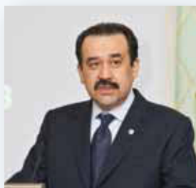
Карим Масимов * Премьер министр Республики Казахстан