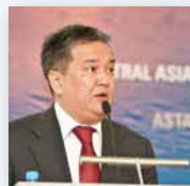
Болат Святлов Председатель правления АО «Национальная горнорудная компания «Тау-Кен Самрук»