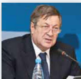
Владимир Школьник Председатель правления АО НАК «Казатомпром»