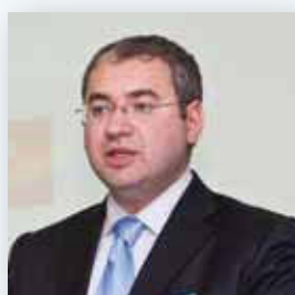
Виталий Несис Генеральный директор ОАО «Полиметалл»