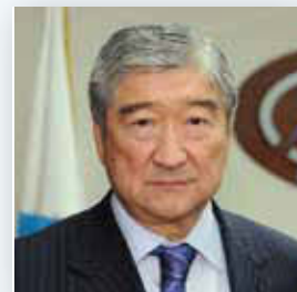
Таир Мансуров Генеральный секретарь ЕврАзЭС