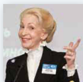
Леди Барбара Томас Джадж Председатель, Агентство Атомной Энергетики Великобритании